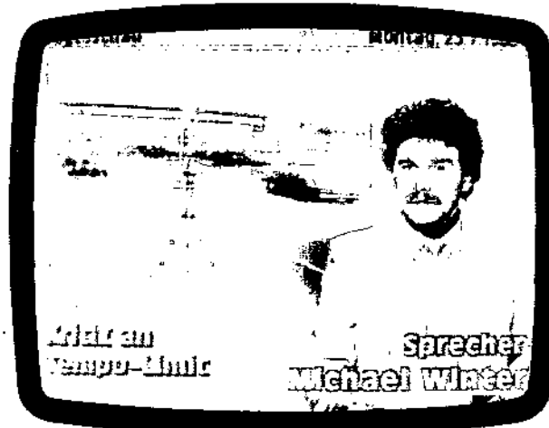
Ersatz-Moderator Winter: Kein Wort vom Streik

Am Montag letzter Woche war's dann soweit. Fast unbemerkt schlich der